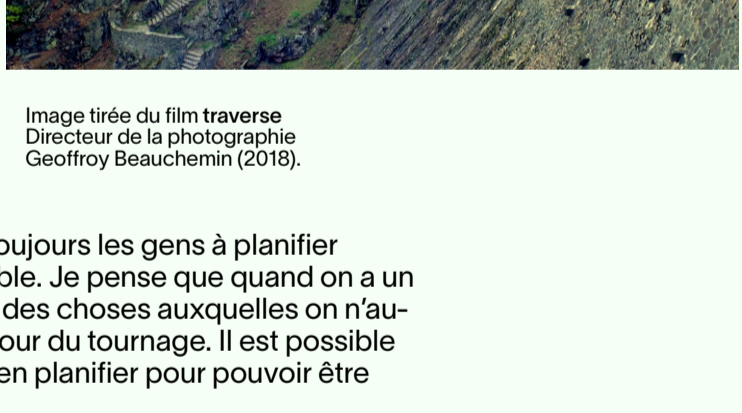
Image tirée du film traverse. Directeur de la photographie Geoffrey Beauchemin (2018).

Lorsque j'enseigne, j'encourage toujours les gens à planifier minutieusement autant que possible. Je pense que quand on a un bon plan, on a le temps d'essayer des choses auxquelles on n'aurait peut-être pas pensé avant le jour du tournage. Il est possible d'être surpris. En cinéma, il faut bien planifier pour pouvoir être spontané.